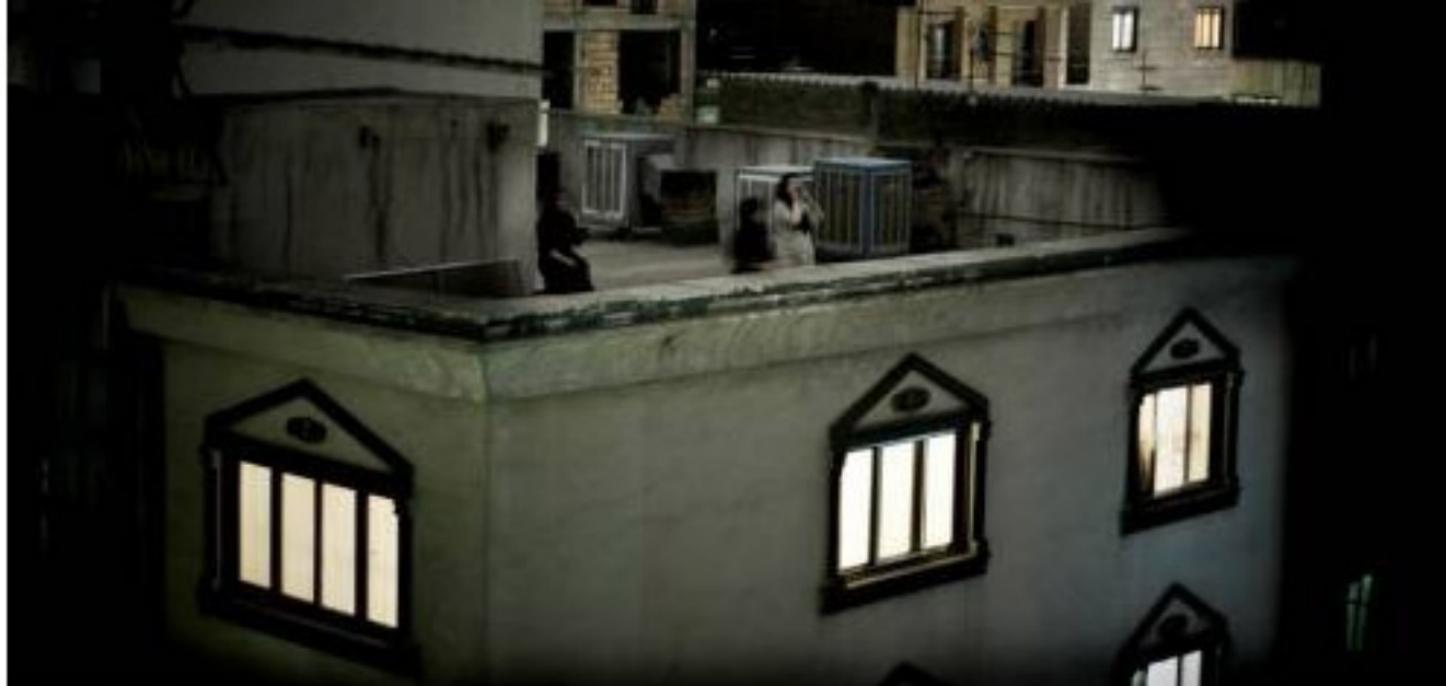
Pietro Masturzo - Dai tetti di Tehran - giugno 2009 - World Press Photo of the Year 2009 - courtesy Contrasto

Emma Dante, Jan Fabre e il corpo degli attori di Giulia Alonzo ... segue