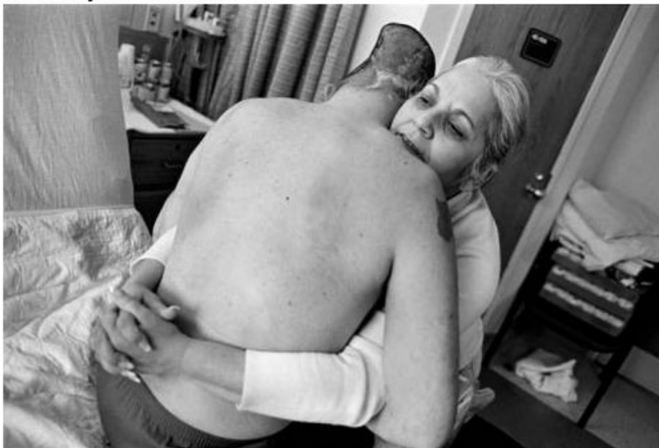
Eugene Richards - 1st prize Contemporary Issues Stories